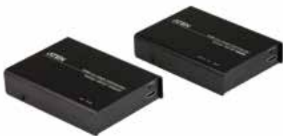
VE812 HDMI Over Cat 5信号延长器 +单网线传输