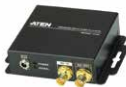
VC480 3G/HD/SD-SDI转HDMI 影音转换器