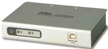
UC2322 / UC4852