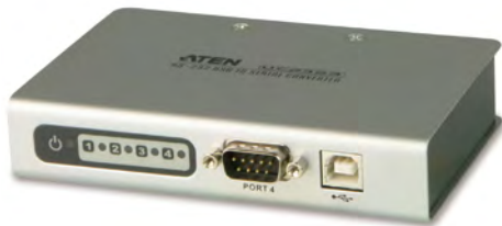
UC2324 / UC4854