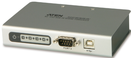
UC2324 / UC4854