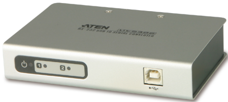
UC2322 / UC4852