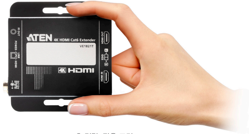
초 경량, 작은 크기