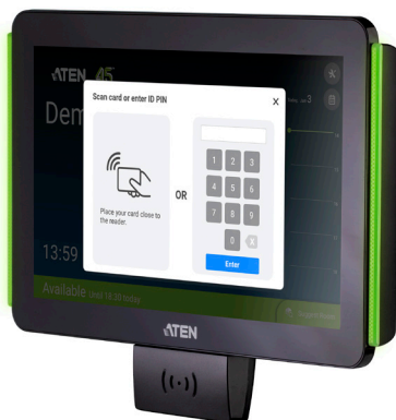
VK430 + VK401

ATEN 회의실 예약 시스템은 ATEN Unizon(글로벌 AV 관리 플랫폼)과 완벽하게 연동되어 회의실 내 장치의 사전 정의된 동작을 자동화하는 시나리오를 제공하여 효율성을 높여줍니다. 또한, 회의실의 실시간 사용량이 ATEN Unizon의 대시보드에 기록 및 표시되어 신속한 유지 관리 및 효율적인 공간 배치가 가능합니다.