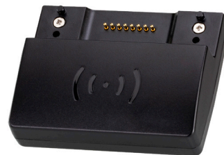
VK401 (엑세스 인스펙터)