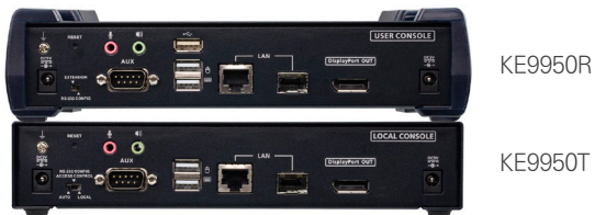
KE9950R / KE9950T 후면