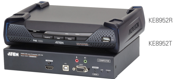
KE8952R / KE8952T 전면