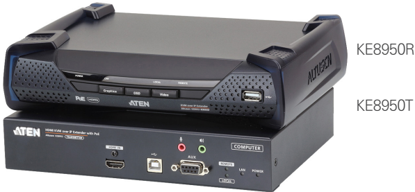
KE8950R / KE8950T 전면