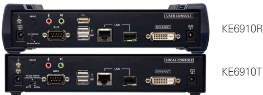
KE6910R / KE6910T 후면