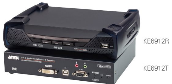
KE6912R / KE6912T 전면