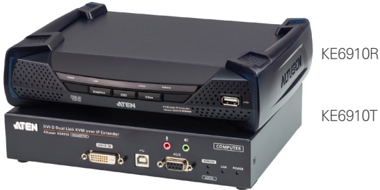
KE6910R / KE6910T 전면