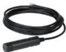
EA1140 / EA1240