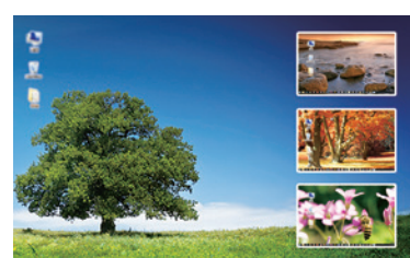
図4:ピクチャ・イン・ピクチャモード クワッド