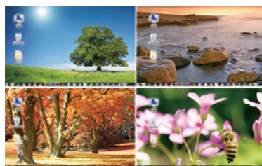
図1:クワッドビューモード コンピュータ4台のビデオ出力を一面に表示