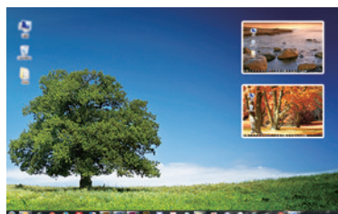
図3:ピクチャ・イン・ピクチャモード トリプル