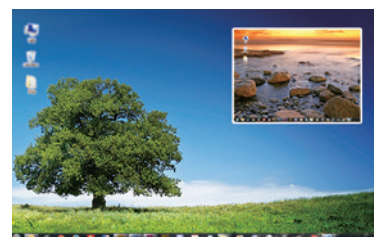
図2:ピクチャ・イン・ピクチャモード デュアル