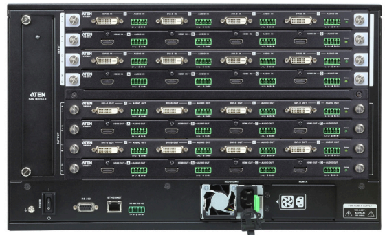
リア（入出力ボード搭載時）