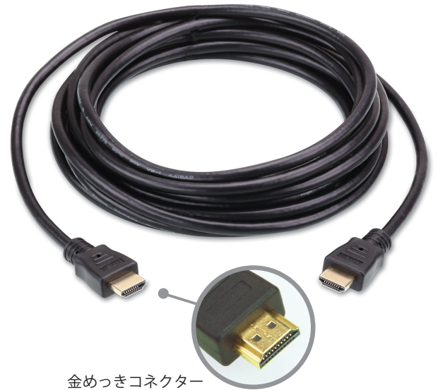
金めっきコネクタ