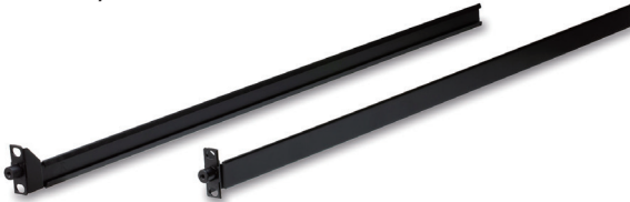
표준 설치 2K-0001 / 2K-0007